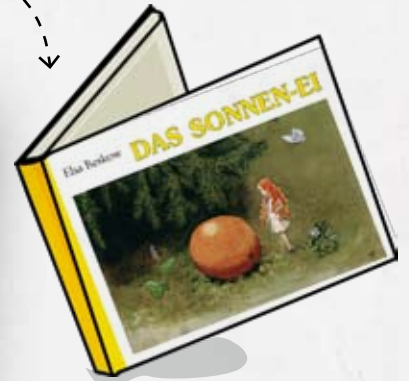
Das Sonnen-Ei, Elsa Beskow (ISBN 978-3-8251-7494-1)

Da liegt eines Tages eine große, gold leuchtende Kugel im Moos. Ein so großes Vogelei hat die kleine Waldelfe noch nie gesehen! Wer mag das bloß gelegt haben? Eine zauberhafte Geschichte vom Leben im nordischen Wald und der Sehnsucht nach dem Sommer